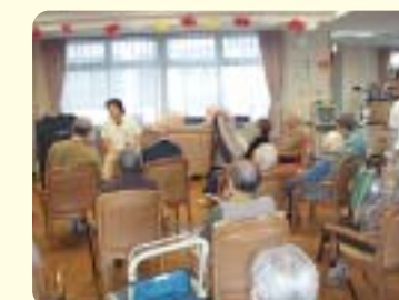
● デイサービスながら TEL 092-477-3139