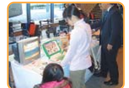
福祉用具展示・体験コーナー