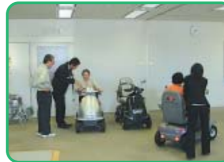
電動車いす試乗会