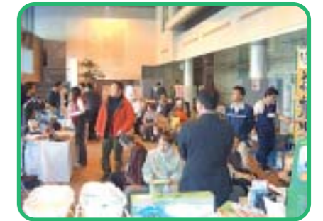
福祉用具展示・体験コーナー